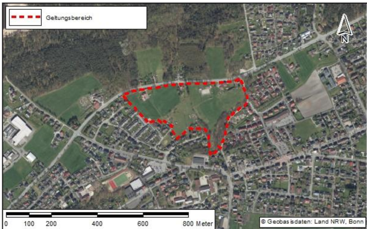
Abb. 2-1: Geltungsbereich der Teilaufhebung im Luftbild

Die geplante Teilaufhebung umfasst einen Geltungsbereich von ca. 9,2 ha. Dieser liegt südlich der Waldstraße (L 758), westlich des Mergelwegs, nördlich der bebauten Wohngrundstücke an der Sandstraße und östlich der bebauten Wohngrundstücke an den Straßen Tonweg, Kieselweg und Untere Reihe. Somit ist der Geltungsbereich mit Ausnahme der nördlichen Umgebung fast ausschließlich von Siedlungsbereichen umgeben (siehe Abb. 2-1).