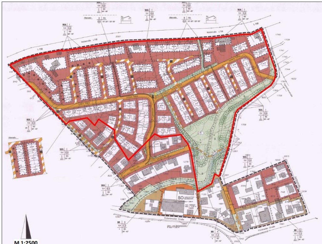
Abb. 2-2: Ausschnitt der Änderung des Bebauungsplanes Nr. 7, Änderungsbereich 7.2 „Im Hässeln“ (GEMEINDE AUGUSTDORF 2001), geplante Teilaufhebung rot umrandet

Ursprünglich sollte der Teilbereich Nr. 7.2 „Im Hässeln“ der planerischen Entwicklung der Augustdorfer Ortsmitte dienen, die räumlich, funktional und gestalterisch prägnant ausgebildet werden sollte. Innerhalb des Geltungsbereichs sollte die Entwicklung eines Allgemeinen Wohngebiets mit Bestandssicherung der damals vorhandenen Einzelhandels- und Dienstleistungsbetriebe stattfinden.